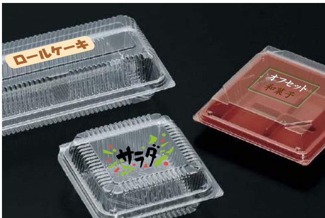
【オフセット】 3色まで印刷可能、OPS製品に適しています。