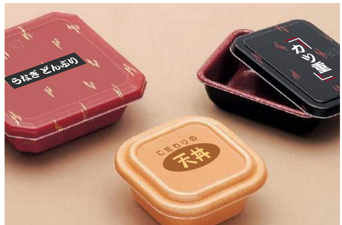
【パット】 2色まで印刷可能、PSP製品に適しています。